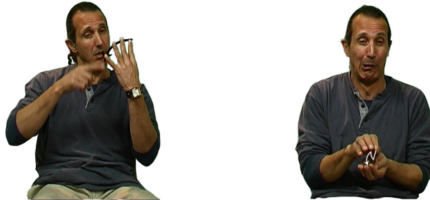
איור 6: סימנים העושים שימוש בדימוי חזותי: א. נעליים 'מפטפות' ב. 'להיות שונים כאצבעות כף היד'

סיפור חייו של אדם זה עשיר בדימויים חזותיים. סימן נוסף שעושה שימוש בדימוי חזותי הוא הסימן המופיע באיור 6 ב. משמעותו 'אינם עשויים מקשה אחת'. אך הדימוי החזותי עליו מתבססת המשמעות הוא שאצבעות כף היד שונות זו מזו. כלומר, תרגום מילולי של הסימן הוא 'להיות שונים זה מזה כמו שאצבעות כף היד שונות זו מזו'. המספר משתמש בסימן כאשר הוא מתאר את המורים השונים שהיו לו בילדותו. המורים, הוא אומר, שונים זה מזה כאצבעות כף היד.