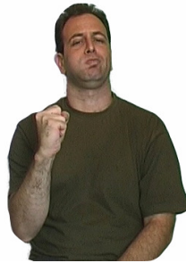
איור 1: הסימן 'להתעקש-להמשיך-לדבר'

שווה זכויות בקהילת השומעים. חוסר השתייכות זה עשוי להביא פעמים רבות לבדידות חברתית. מבחינת החירשים, התמיכה החברתית של קהילת החירשים והיכולת לתקשורת שוטפת באמצעות שפת הסימנים עדיפים על פני יכולת שמיעה טובה יותר. עד כה התמקדתי בכמה מאפיינים של קהילת החירשים הנוגעים להתייחסות לחירשות עצמה. אך לקהילת החירשים גם מאפיינים חברתיים ייחודיים לה. לדוגמא, בקהילה זו יש חשיבות רבה מאוד למפגשים חברתיים ותקשורת של פנים מול פנים. איפיון זה נובע מכך שבעבר, לפני המצאת הפקס, האינטרנט, ה-SMS וטלפוני הוידאו, התקשורת של חברי קהילת החירשים היתה אפשרית רק באמצעות מפגש בין האנשים. גם כיום, עם כל החידושים הטכנולוגיים, עדיין יש חשיבות רבה למפגשים חברתיים, ומפגשים אלו בדרך כלל אורכים שעות רבות. בשפת הסימנים הישראלית ישנו סימן מיוחד, שניתן לתרגם אותו כ'להתעקש להמשיך להישאר ולדבר' (איור 1). סימן זה משמש הרבה בהקשר של חוסר רצון להיפרד בסיומו של אירוע חברתי. חירשים מספרים כי הדרך מחדר האורחים לדלת בסיומו של אירוע חברתי יכולה לארוך כמה שעות, כי כל המוזמנים 'מתעקשים' להמשיך ולשוחח, ואינם רוצים לעזוב (מאיר וסנדלר 2004, עמ' 66). 8 נראה כי בנוסף לצורת התקשורת המשותפת, גם הרגשת ה'ביחד', ההימצאות עם אנשים 'כמוני', נותנת תחושת שייכות ותמיכה שקשה לחוות אותה במעגלים חברתיים אחרים.